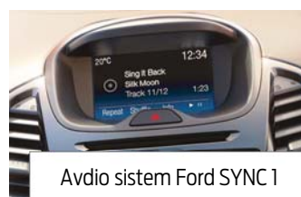
Avdio sistem Ford SYNC 1