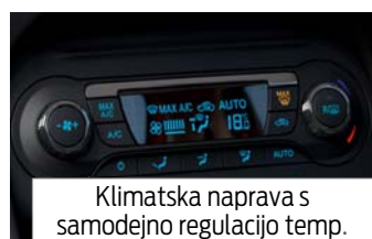
Klimatska naprava s samodejno regulacijo temp.