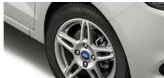
Platišča iz lahke zlitine