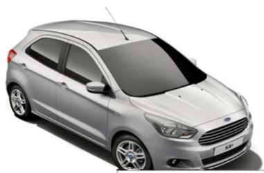
Moon dust Silver