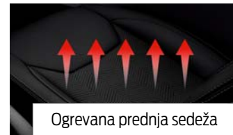
Ogrevana prednja sedeža